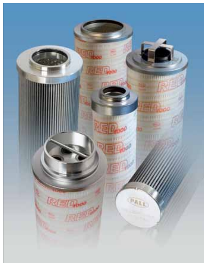
Фильтроэлементы Pall Red 1000 для фильтров Hydac

Рассчитанные на применение в областях, где эффективная фильтрация необходима для увеличения ресурса систем, снижения времени простоев и повышения производительности, фильтроэлементы Red 1000 выпускаются для широкого спектра корпусов Hydac. Множество вариантов фильтроэлементов Pall Red 1000 как по тонкости фильтрации, так и по исполнению (со встроенным байпасным клапаном или без него, рассчитанные на высокое или низкое разрушающее давление) позволяют выбрать оптимальное решение для защиты самых разных систем.